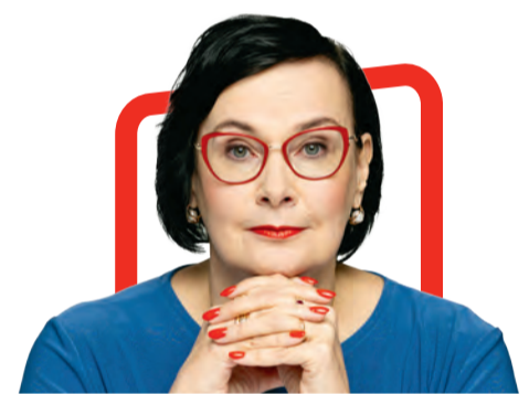
Katri Raik бывший мэр Нарвы и экс-министр внутренних дел