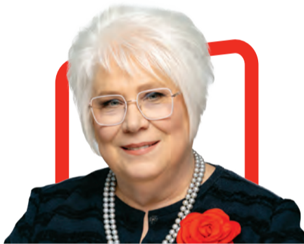
Marina Kaljurand депутат Европарламента, бывший министр иностраннных дел