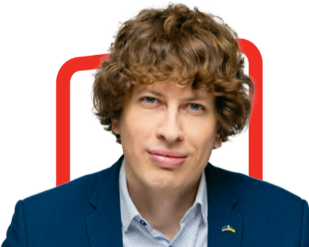
Tanel Kiik депутат Рийгикогу, бывший министр здоровья и труда