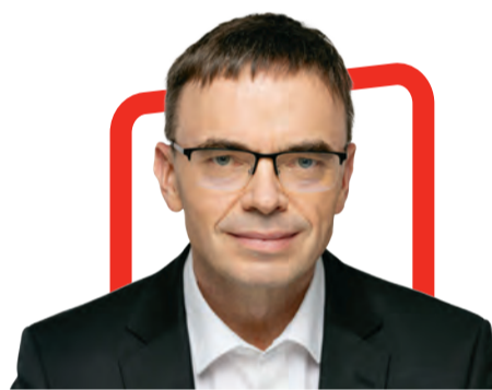
Sven Mikser депутат Европарламента, бывший министр обороны и иностраннных дел