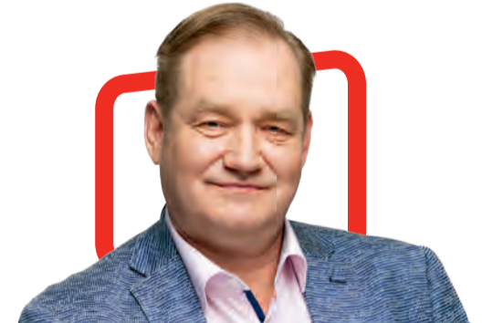
Ivari Padar бывший депутат Евро- парламента и экс-министр сельского хозяйства