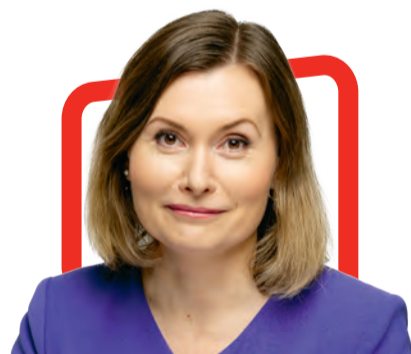
Riina Sikkut министр здоровья, бывший министр экономики