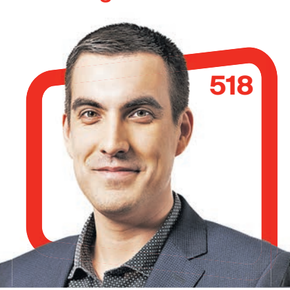
Karl Kirt Tarvastu Gümnaasiumi